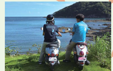
(見本用のナンバープレートを使用しています)

ご当地ナンバーで、下田を走ってみませんか? ゆるキャラ「ペるりん」をモチーフに、美しい下田の海をイメージしたご当地ナンバープレートを交付しています! 新規登録はもちろん、既存のナンバープレートからの交換も無料です! 詳しくは、市ホームページをご参照いただくか、税務課(☎ 22-2218 内線 283)までご連絡ください。