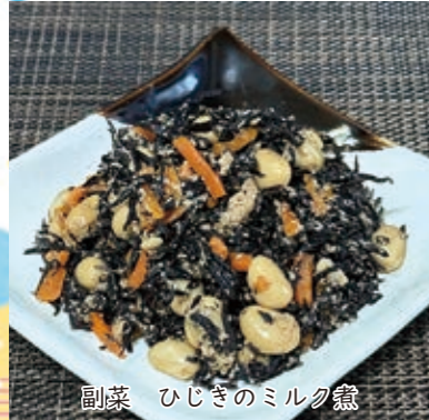
副菜 ひじきのミルク煮