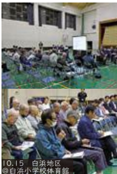
10.15 白浜地区 @白浜小学校体育館

A 下田メディカルセンターは、賀茂地域の二次救急病院となっているが、人口が減少する中で、二次救急の体制維持と医師確保に苦慮している。