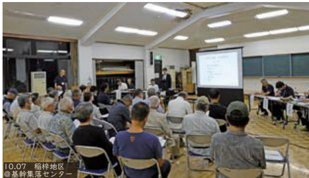
10.07 稲梓地区 @基幹集落センター

会場でいただいたご意見や質問等に対し、当日お答えした内容も含め、まとめています。詳細は市ホームページにて公表しておりますが、それらの一部について、主な内容をご紹介します。