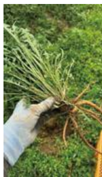
タンポポの根っこ

タンポポ？と思った方も多いかと思います。実は、タンポポの根でコーヒーが作れるんです！ノンカフェインで母乳の出が良くなると言われているので、様々な効能が期待できるといいます。特に妊婦さんや授乳中の女性が飲まれるケースが多いそうです。