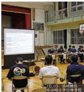
10.10 浜崎地区 @浜崎小学校体育館

A 公共交通機関について、夜間にタクシーが少なく、食事へ出ると帰って来れないと聞く。