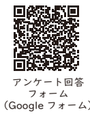
アンケート回答フォーム (Google フォーム)