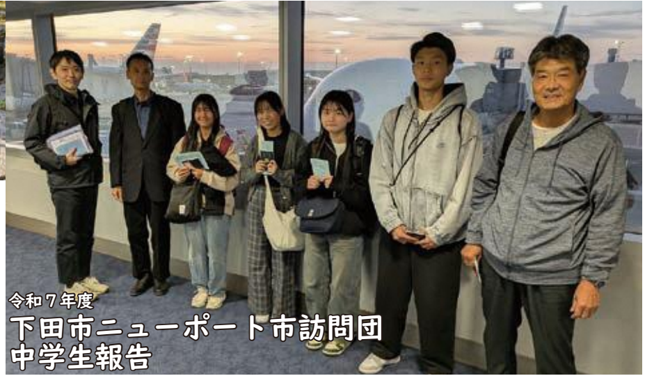
令和7年度 下田市ニューポート市訪問団 中学生報告

今回のニューヨーク市訪問は、初めての海外へ行くことにワクワクしました。しかし、英語を使って会話することやアメリカの文化に馴染めるかどうか心配でした。実際にいくと、自分の予想以上に大変なことが多く、一日目は精神的に疲れてしまいました。しかし、時間とともにアメリカの地に慣れていき、スーパーで買い物をして、地域の人と関わった結果、だんだんと初めての経験が楽しく感じてきました。