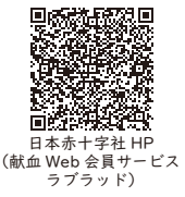
日本赤十字社 HP （献血 Web 会員サービス ラブラッド）