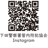
下田警察署管内防犯協会 Instagram