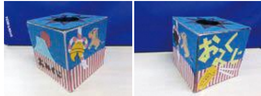
下田中学校生徒さん制作おみくじ箱

おみくじ箱は、昨年10月に図書館に職場体験に来てくださった下田中学校の生徒さんが、心を込めて制作してくださいました。ご来館の際にぜひご覧ください！