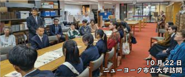
10月22日 ニューヨーク市立大学訪問