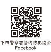
下田警察署管内防犯協会 Facebook