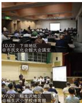
10.02 下田地区 @市民文化会館大会議室

人件費の削減は、職員の就業意欲の低下や新規の職員採用等で困難な状況を招く恐れがあることから、「最後の手段」として考えており、現時点では検討する段階ではないと判断している。また、「稼ぐまちへの転換」を図るプロジェクトを推進しており、ふるさと納税の強化や公共施設の利活用の検討、目的税の導入、施設使用料の受益者負担額の検討等を行っていく。