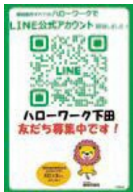
ハローワーク下田 友だち募集中です！