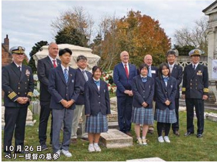
10月26日 ペリー提督の墓参