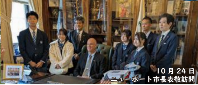
10月24日 ニューポート市長表敬訪問

今回のニューヨーク市訪問は、初めての海外へ行くことにワクワクしました。しかし、英語を使って会話することやアメリカの文化に馴染めるかどうか心配でした。実際にいくと、自分の予想以上に大変なことが多く、一日目は精神的に疲れてしまいました。しかし、時間とともにアメリカの地に慣れていき、スーパーで買い物をして、地域の人と関わった結果、だんだんと初めての経験が楽しく感じてきました。