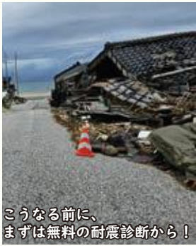
こうなる前に、 まずは無料の耐震診断から！