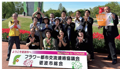
前回の様子(富山県砺波市)