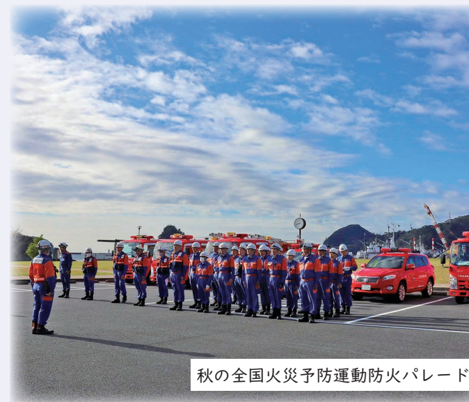
秋の全国火災予防運動防火パレード

市内に居住または勤務している18歳以上の健康な男女であれば、どなたでも入団することができます。