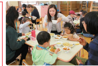
こども園給食体験