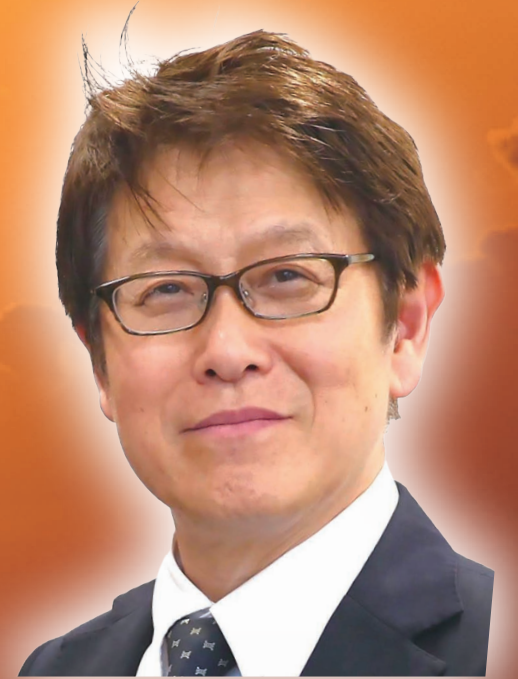
下田市長 松本 正一郎