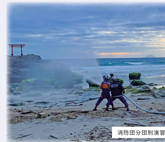
消防団分団別演習