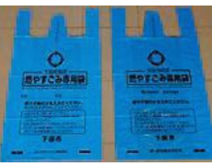
記名式(左)と無記名式(右)ごみ袋

問合せ先 環境対策課 ☎2213 現在、プライバシーの観点から試験的にごみ袋を無記名式に変更しています。店舗によつては記名式と混在していますが、無記名でごみ出しが可能です。これまでどおりごみを出す際には、ルールとマナーを守るようお願いいたします。