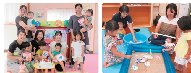
誕生会 夏祭りごっこ

9月から「年齢別ルーム」が始まります。年齢にあった玩具、環境を用意しています。同年齢の子と一緒に遊びながら親子で交流を深めていきましょう。第1・2・3水曜日の午前は、年齢指定の日になります。遊びにきてくださいね!