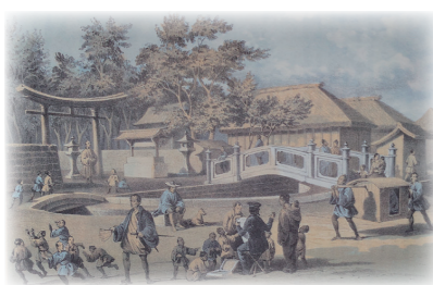
下田八幡神社前 (画：ハイネ) 『バリ艦隊遠征記』所載

海運が主要な物流経路であった江戸時代、港町である下田では江戸や上方の文化がいち早く流入したと言われています。同じように、今度は開国によって外国船が碇泊し、一時的にはありますが、下田は海外の文化を受容する窓口となり、早い段階から外国人との交流も見られました。そして、異なる文化に出会うというのは、時に衝突を伴うこともあります。下田が開港地としての役目を果たすことができたのは、古くから海を通じて外部に開かれてきた歴史があったというの大きな理由ではないでしょうか。