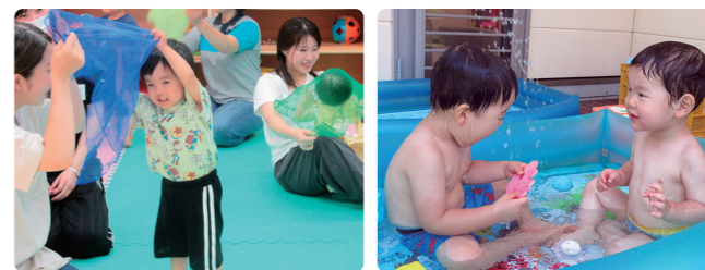
親子で楽しいリズム遊び プール遊び

日中は日差しが厳しいですが、朝夕の風が心地よく感じられるようになってきました。夏から秋へと季節がバトンタッチするようですね。今年の支援センターの夏は、お家の人と一緒にたらいやビニールプールの水遊びを毎日楽しみました。