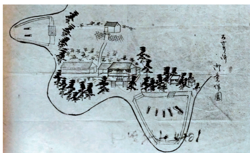
州佐里崎御台場図

財政難によって建設は一度中止してしまいましたが、アヘン戦争での清国の敗北を知り、危機感を募らせた幕府は1842年（当初の計画から35年後）に州佐里崎と狼煙崎に御台場を建設しました。