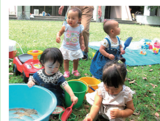
敷根公園で遊ぼう

木々の葉が色づき始め、秋の深まりを感じる季節となりました。一年の中でも過ごしやすいこの時期です。お散歩をしたり戸外で秋の自然に触れながら遊ぶのも楽しいですね。しかし、この時期は一日の気温差が大きく衣服の調節が難しいですね。子どもは新陳代謝が活発なので大人と同じように着ていると汗をかき風邪をひきやすくなります。上着で調節し日中は薄着で過ごせるようにしましょう。