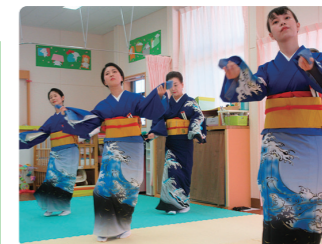
下田の伝統芸能を見てみよう

※予定は変更になる場合があります。 詳細は子育て支援センターまでお問い合わせください。