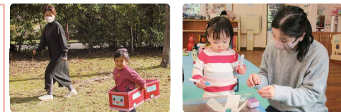
数根公園で遊ぼう こま作り

※予定は変更になる場合があります。 詳細は子育て支援センターまでお問い合わせください。