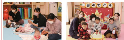
赤ちゃんとのふれあいタイム 誕生日会

ウメのつぼみがほころび始め、ようやく季節の移り変わりを感じられるようになってきました。少しずつ春の音が聞こえてくるようです。支援センターの花壇のチューリップの球根は芽を出し、春を心待ちにしています。また、体調管理が難しい時期ですので、手洗い・栄養・睡眠で元気に過ごせるようにしていきましょう。 支援センターでは、換気や消毒をして衛生的で安全な環境を作り、皆さまをお待ちしています。