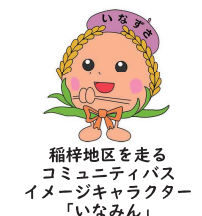
稲梓地区を走る コミュニティバス イメージキャラクター 「いなみん」