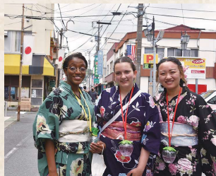
開国のまち下田を楽しむ