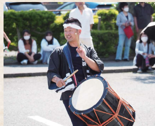
豆州白浜太鼓が鳴り響く