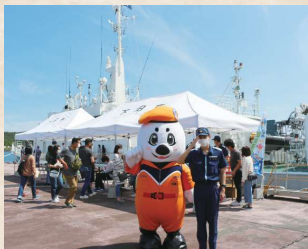
海上保安庁巡視艇「かの」一般公開