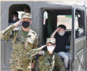
自衛隊による車両展示