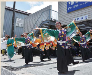
静岡大学よさいサークル「お茶ノ子祭々」