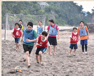
年代を越えて行われた「ビーチサッカー」