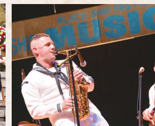
黒船サンセットコンサート