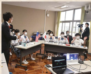
ニューポート市の学生とのオンライン交流