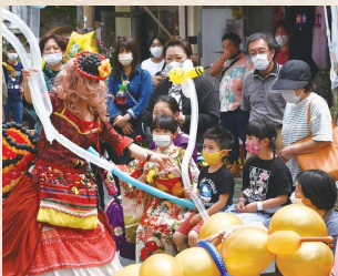
大道芸がまちを盛り上げた