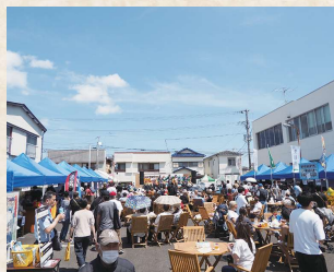
にぎわいを見せる KIZUNA 広場