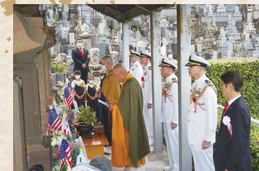
おごそかに行われた黒船将兵墓前祭（玉泉寺）