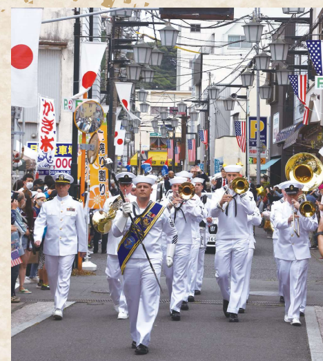
記念公式パレード（米海軍第7艦隊音楽隊）