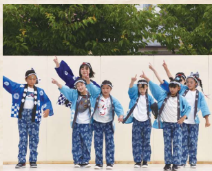
にぎわいコンサート