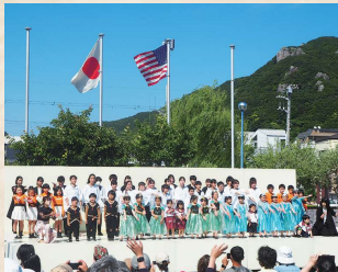
T.C. Dance Company によるダンス発表