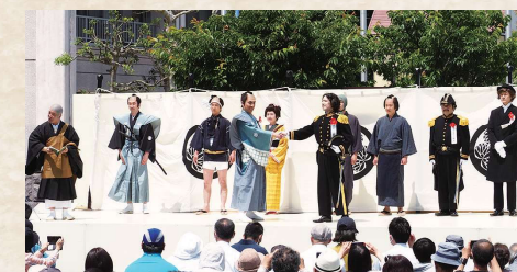
リニューアルされた再現劇「日米下田条約調印」