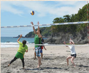
男女混合の「ビーチバレー」