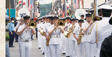
にぎわいパレード（海上自衛隊横須賀音楽隊）