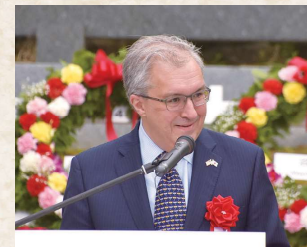
マシュー・センザー在名古屋 米国領事館首席領事