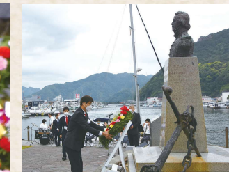
ペリー艦隊来航記念碑献花式