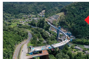
（仮称）河津 IC 付近

国道414号の迂回路となる東海岸沿いの国道135号や、西海岸沿いの国道136号も雨量規制により通行がままならず、伊豆急行線の運休も重なり、伊豆半島南部は孤立化した状況となりました。地域の皆さまの車での移動だけでなく、物流や病院への緊急搬送等、大きな影響を及ぼしました。市は「防災・減災・国土強靱化」に向けたまちづくりを目指し、災害に強い道路ネットワークの整備は必要不可欠であり、伊豆縦貫自動車道の早期完成を促進しています。