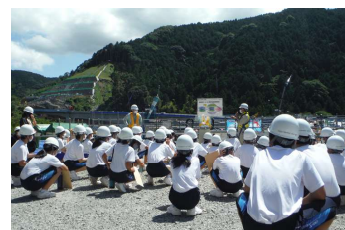
工事現場見学の様子

「河津下田道路（II期）」の区間が開通すると、通行時間が約16分短縮されるだけでなく、運転のしやすさも効果として期待され、また、観光バスを含む夏季大型車通行規制区間の迂回が解消されます。医療面においても、救急指定