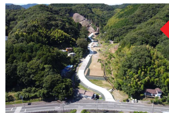
（仮称）下田北 IC 付近