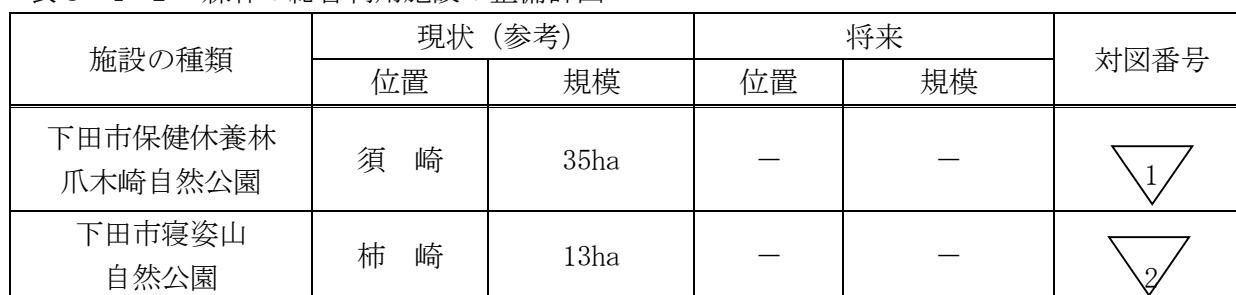
表5-4-1 森林の総合利用施設の整備計画