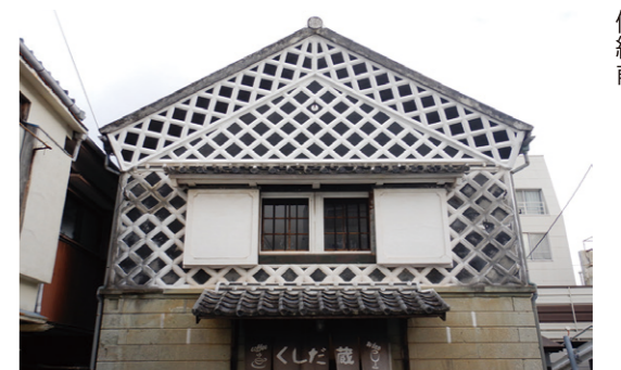
建物外観一部修景（なまこ壁修繕）