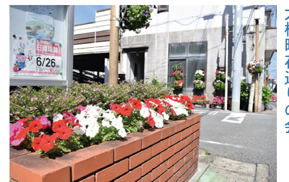
大横町花通りの会 周辺の景観に配慮した庭先又は玄関先にするための協定