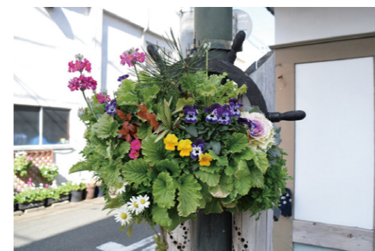
三丁目花通りの会 周辺の景観に配慮した庭先又は玄関先にするための協定

3軒以上が参加する協定において、庭先や玄関先を植栽等で景観的に配慮する場合に適用されます。