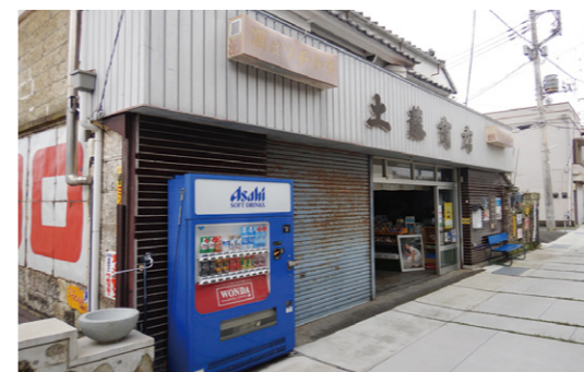
建物外観一部修景（木製引戸への改修）