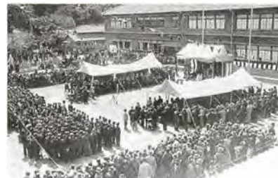
黒船祭式典会場（旧下田小学校々庭にて）