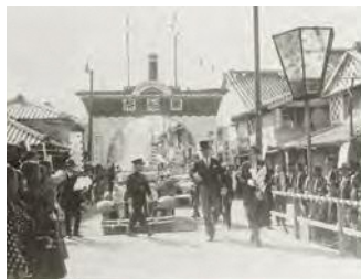
第 1 回黒船祭歓迎アーチとグルー大使夫妻