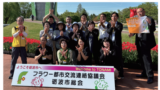
前回の様子(富山県砺波市)