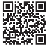
ふじさんっこ☆ 子育てナビ QR

静岡県子育てポータルサイト「ふじさんっこ☆子育てナビ」では、子育てに関する情報や相談窓口を紹介しています。