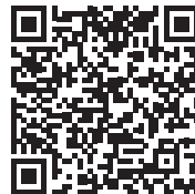
市ホームページ QRコード