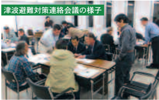
津波避難対策連絡会議の様子

津波避難については、避難対象地区、人数などを明確にし、緊急避難場所を定め、繰り返し避難訓練を行うことが重要です。避難を初めから