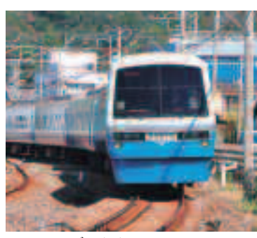
リゾートドルフィン号

伊豆急行線内「自由席特急回数券」割引拡大 10枚つづり1,000円(これまで2,000円)に値下げしました。1回あたり100円、これなら、存分に「踊り子号」に乗れます。 3月1日から「60(ロクマル)定期」新発売 60歳以上に限定した一か月定期を新たに発売します。お値段は通勤定期の半額! 問合せ先 伊豆急行株式会社 ☎05571531116