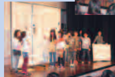
昨年度シンポジウムの様子