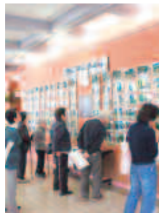
ギャラリーの様子

「下田まち遺産ギャラリー」におい ては、市内外の方々から241件のア ンケートを得ることができ、そのうち 75%の方にこの企画を『楽しめた』と の回答をいただきました。主なアンケ ートの結果は次のとおりです。その他、 いただいたご意見や提案は今後の展開 の参考とさせていただきます。