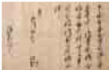
北条家寺中安堵朱印状(本覚寺蔵)

田原の後北条氏を攻めた天正18年(1590)4月に、豊臣方の武将安国寺恵瓊が下した制札(豊臣軍の狼藉を禁じた書状)は、下田城攻防戦の最中に書かれており、豊臣方が陸海の双方から下田城を攻め、落城前に横川が豊臣支配下にあったことを示す重要な証拠となっています。