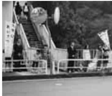
昨年のあいさつ運動

● 街頭キャンペーン 日時 11月4日(火) 午後5時45分頃～6時30分頃 場所 市内量販店等 内容 啓発チラシ等の配布