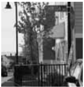
下田通りと命名されているニューポートの市道

昭和35年4月、日米修好100周年を記念し下田町長がニューポート市を訪問、昭和37年5月の第23回黒船祭にニューポート市長代理夫妻が来田しました。その後、小中学生による文通、絵画の交換などの交流が行われていました。昭和59年には、日米和親条約締結130周年を記念して、ニューポート市においても黒船祭が開催されるようになり、以降相互訪問による交流も活発に行われるようになりました。下田市からニューポート黒船祭へは、第1回から第24回(平成19年)まで約280名が、ニューポート市から下田黒船祭には約170名が訪れ交流を深めています。中学