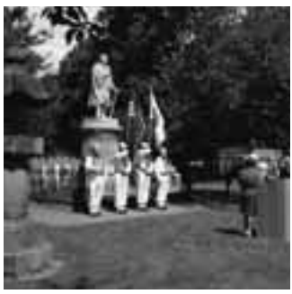
ニューポート黒船祭式典