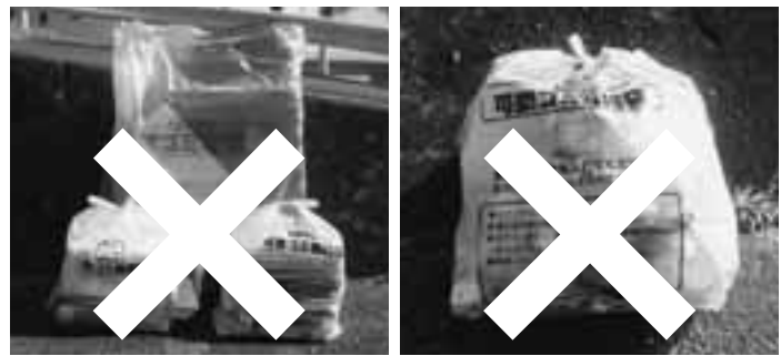
大量の古紙類・ペットボトル入りの袋入りの袋は収集しません

分別収集が市内全域で実施されましたが、未だに大量の古紙、ペットボトルなどを可燃ごみとして出す方がいます。4月以降、大量の古紙・ペットボトルなどが可燃ごみとして出されていた場合、収集しません。また、電話・手紙などで、ご連絡させていただくことがあります。