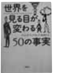
世界を見る目が変わる50の事実 ジェシカ・ウィリアムズ 著