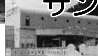
サンシップ今井浜▶

この度、河津町と「公の施設の相互利用に関する協定」を結び、お互いの住民が市町の施設を利用できるようにになりました。