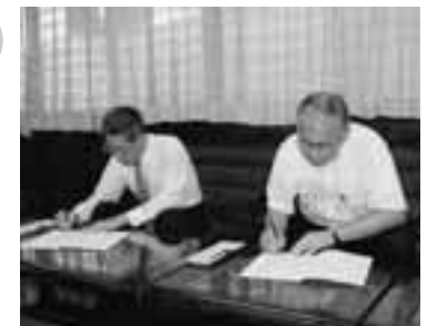
協定書にサインをする河津町長と下田市長