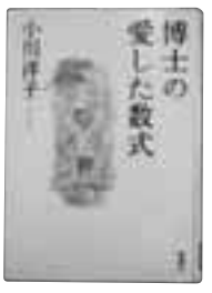
博士の愛した数式 小川洋子 著

今年4月に市役所に採用された職員に「私のすすめるこの一冊」として紹介してもらいました。 家政婦と、交通事故の後遺症によって80分しか記憶がない博士と、ルートと呼ばれる家政婦の息子の3人によって繰り広げられる物語。事故の後遺症という残酷な事をテーマに入れながらも、博士のルートに対する愛情の深さやルートの優しさ、家政婦の誠実さ