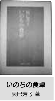
いのちの食卓 辰巳芳子 著

によって、温かさが感じられとてもおもしろい一冊でした。 私は題名に惹かれてこの本を購入しました。この本には、私たちの身近な問題のほかに、今この地球上で本当に存在しているのか疑ってしまう様な社会や問題が書かれていて、肅然とさせられました。どの現実も一朝一夕で片づく事ではありませんが、同じ地球上に住む者として、知っておきたい事だと感じました。