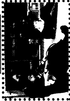
「お母さんとふれあい遊び」 ~♪♪スに乗って~ゴォー!ゴォー!