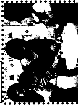
「お誕生日おめでとう!!」 美味しそうなケーキに思わず 手が伸びちゃうよ~