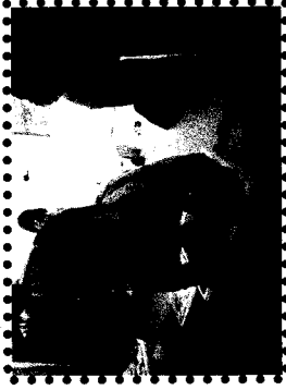
「うんとこしょよ!!」大きくなっ たかな?自分で体重計に乗って みようっつと...