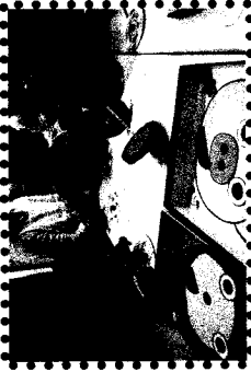
こまが、くるくる回ってきれ いな色になったね