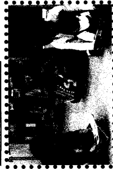
大好きなお母さんの膝の上 で読み聞かせだよ